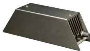
Aircode™ RX-100 Placering: Fritt i lokal Energiförbrukning: 10W Vikt: 0,5 KG Mått: L: 20 CM B: 6 CM H: 6 CM Finns i både vitt & rostfritt.

I salonger som arbetar med naglar och fransförlängning finns det mängder med farliga partiklar och gaser i luften. Fransstylisterna klagar allt mer på kronisk nästäppa, plötslig rinnsnuva och nysningar, hosta och förvärrad astma. Hos många salonger luktar det så pass starkt att kunder inte kan stanna kvar. Värst är det för stylisten som ofta vistas i lokalerna flera timmar varje dag.