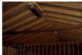
Stand alone monterad