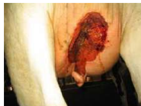
Juver med resistenta bakterier och svårt sår. Ingen effekt av antibiotika