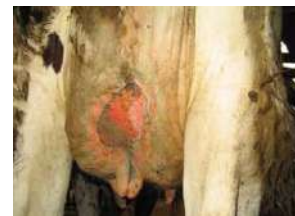
Juver efter 3 veckors daglig rengöring och sårvård med ANK Anolyt