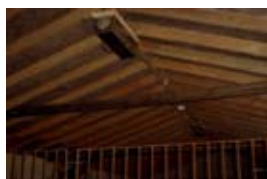
Stand alone monterad